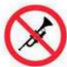
Instrumentos sin autorización previa Instruments without previous authorization