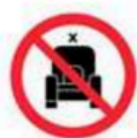
Ocupar localidades no asignadas Occupancy seats not assigned