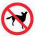
Mascotas (excepto perros guía) Pets (except guide dogs)