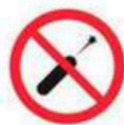
Punteros láser Lasers