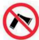
Bocinas Air horns