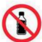
Botellas y recipientes superiores a 500 ml (tapones retirados en cualquier caso) Drinking bottles and vessels above 500 ml (all bottle lids will be removed)