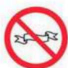
Banderas y pancartas superiores a 2x3m (prohibida cualquiera ofensiva) Flags or banners bigger than 2x3m (offensive ones any size are prohibited)