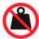
Objetos superiores a 500g Objects heavier than 500g