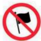
Palos y mástiles Sticks and masts