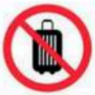
Maletas y equipaje de mano Suitcases and hand luggage