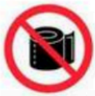
Papel higiénico y similar Toilette paper and similar