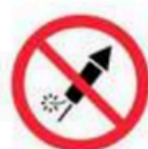
Bengalas y fuegos artificiales Flares and fireworks