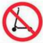
Patinetes y monopatines Scooters and skateboards