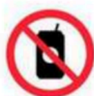
Vasos de vidrio y latas de bebidas (cualquier tamaño) Glass cups and canned drinks (any size)