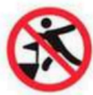
Invasión del terreno de juego Pour in to the pitch

La organización se reserva el derecho de denegar el acceso o expulsar del Estadio a quien incumpla cualquiera de estas disposiciones, sin derecho a reembolso alguno