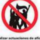
Realizar actuaciones de acción visitante en zona local supone riesgo Perform visiting fan actions in local area if it may provoke a risk