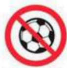
Pelotas de cualquier tipo y medida Balls any size and type